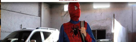
ESCALA EN PARÍS